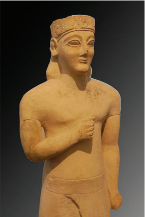
1- Auteur anonyme, Kouros archaïque, vers 600 avant J.C., Marbre de Paros ; Altes Museum de Berlin.

« Simplification et stylisation des formes », définitions : Simplification : action d’enlever de la complexité, de réduire les difficultés en donnant plus de cohérence à un ensemble. Stylisation : fait de représenter un objet en le réduisant à ses caractères les plus typiques ou en lui donnant une configuration particulière. Simplifier puis styliser des formes sont des actions fréquentes depuis que l’Homme s’exprime graphiquement. Cela correspond à une certaine vision du monde, mais cela est parfois tout simplement pratique pour faire passer des messages particuliers.