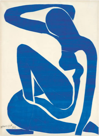
3- Henri Matisse, Nu bleu (I), 1952, Fondation Beyeler, Riehen/Bâle