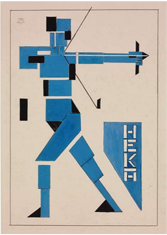
5- Théo Van Doesbourg, Affiche Archer , 1919, Crayon et gouache sur papier, 224 x 317 mm.