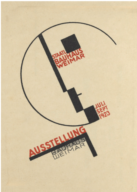
6- Herbert Bayer, Affiche Exposition au Bauhaus de Weimar , 1923, 300 x 420 mm.

2.1 En faisant appel à vos connaissances et en vous appuyant sur les documents N° 4, 5 et 6, précisez le contexte social, politique, culturel et artistique de ces affiches. 3 pts