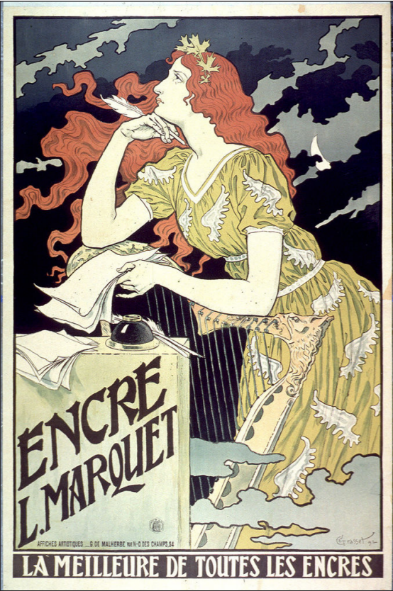
7- Eugène Grasset, Encre L. Marquet , la meilleure de toutes les encres, 1892, 81 x 121 cm.