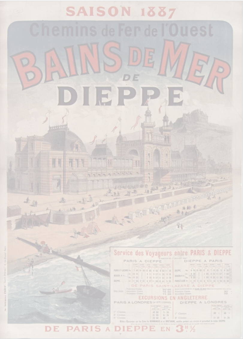
9.b- Anonyme, Affiche Bains de mer de Dieppe,1887.

5.2 Sur le document ci-dessous (document N° 9.b), tracez les lignes de perspective et le point de fuite 2 pts