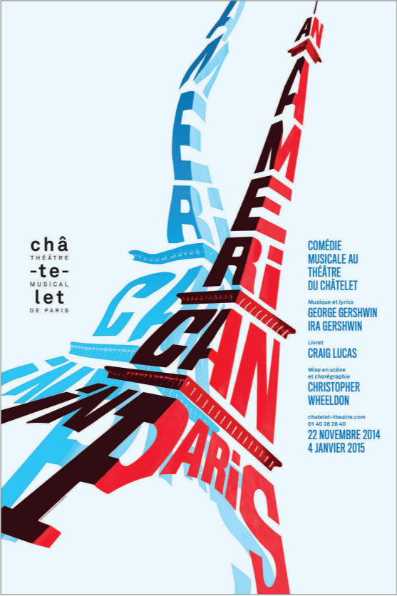
9.e- Philippe Apeloig, Affiche An American in Paris pour le Théâtre du Chatelet, 2015

Pourquoi, selon-vous, l’auteur a-t-il choisi d’inscrire le titre du spectacle dans une forme représentant la tour Eiffel ? 1 pt