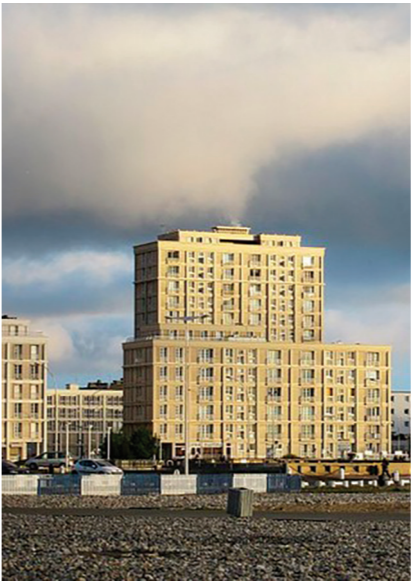
9.c- Ville du Havre, détail, www.gralon.net , Copyright : Velvet.

5.3 En vous basant sur le travail de simplification des formes et de stylisation de l’architecture du Havre (doc N° 9-c) réalisé par Philippe Apeloig ci-dessous, répondez aux questions posées par rapport au visuel N°9-e.