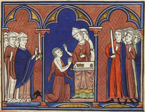
2- Auteur anonyme, Ordo pour la consécration et le couronnement du roi, 1250-1260, Parchemin 145 fol., 22 x 15 cm, Paris, BNF, Manuscrits, Latin 1246.