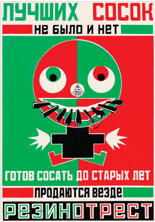
4- Vladimir Maïakovski et Alexandre Rodchenko, Affiche tétines , 1923, 700 x 1000 mm.

« Simplification et stylisation des formes ». Simplification : action d'enlever de la complexité, de réduire les difficultés en donnant plus de cohérence à un ensemble. Stylisation : fait de représenter un objet en le réduisant à ses caractères les plus typiques ou en lui donnant une configuration particulière. Simplifier puis styliser des formes sont des actions fréquentes depuis que l'Homme s'exprime graphiquement. Cela correspond à une certaine vision du monde, mais cela est parfois tout simplement pratique pour faire passer des messages particuliers.