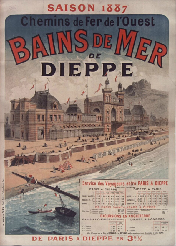
9- Anonyme, Affiche Bains de mer de Dieppe , 1887.

Il étudie à l'École supérieure des arts appliqués Duperré et à l'École nationale supérieure des arts décoratifs (Ensad). Son travail graphique se base sur des recherches autour de la typographie, de la composition, de la simplification des formes . Ainsi, il cherche à se débarrasser du superflu pour se concentrer sur la puissance visuelle des signes.