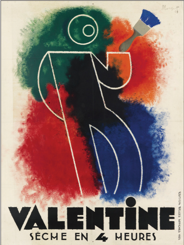
8- Charles Loupot, Valentine , 1929, 118 x 157 cm.

3.1 Observez les documents N° 7 et 8 présentés ci-contre. Ils présentent deux façons bien distinctes de représenter le corps humain.